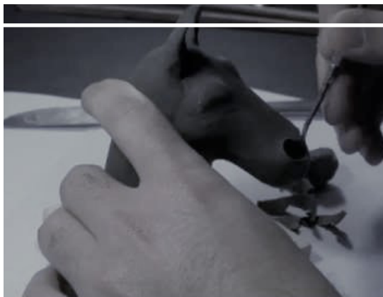
(Imagen: "Cámbrico bis" de José Arreguín Acosta)

Corría el año de 2003 y yo disfrutaba de unas vacaciones de verano. Como cualquier niño de 13 años, buscaba entretenerme con cualquier cosa que no me recordara a la escuela; por suerte, mi madre acostumbraba a buscar para mí diversas actividades recreativas como natación o tae kwondo (tras la fiebre de haber visto todas las películas de Karate Kid). Sin duda, aquellos fueron buenos tiempos. Hoy día cualquiera puede ver que mis aficiones no se inclinaron por el atletismo. Me conformo con flotar sin tragar agua en una alberca, pero aprendí que desarrollar el hábito