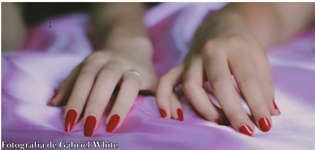
Fotografía de Gabriel White

Al encontrarnos solos en el cuarto comenzó a quitarse la ropa. Cómo olvidar aquella lencería roja. Era año nuevo. La comprendía. Buscaba amor. Se acercó a mí esperando que yo la tocara. Se veía tímida como si fuese su primera vez, no lo era. Besé su vientre varias veces, le pedí que se hincara mientras yo me encontraba sentado en la cama. Lo hizo. Con mis dos manos acerqué su frente a mi boca. La besé con delicadeza. Algo me detuvo. Le pedí se parara de nuevo. La aprecié el mayor tiempo posible. Con mis manos la iba reconociendo. Toqué sus pies y pasé mis dedos entre los suyos. Palpé sus muslos pero me contuve a tocarle la entrepierna. Besé otra vez su vientre. Mis manos inquietas deseaban tocar sus pechos, me negué a mí mismo. Le pedí que se vistiera de nuevo. A pesar del deseo entre ambos. Mi mente me recordaba una y otra vez que, aquella mujer era la esposa de mi hermano.