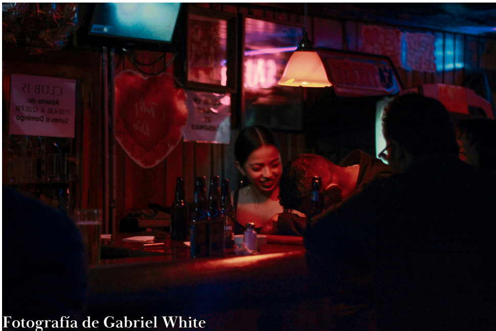
Fotografía de Gabriel White