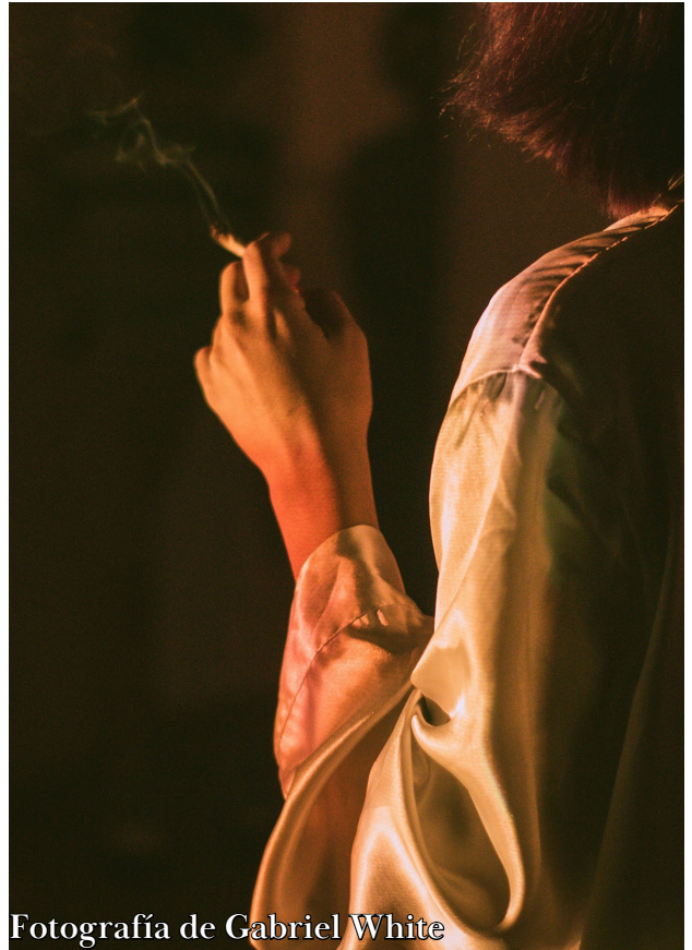
Fotografía de Gabriel White

Tu nombre, tu nombre como anzuelo prendido a mi corazón.